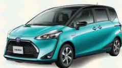
Photo: G Cuero (ハイブリッド車)。ボディカラーのブラックマイカ(209) × ラディアントグリーンメタリック(6W9) [2SK] はメーカーオプション。