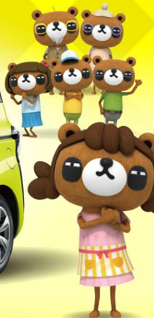
PHOTO: X (ハイブリッド車)、ボディカラーのブラックマイカ(209) × エアーイエロー(586) [2SH] はメーカーオプション。