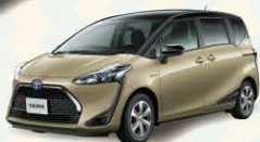
Photo: FUNBASE G (ハイブリッド車)。ボディカラーのブラックマイカ(209) × ベージュ(4V6) [2SG] はメーカーオプション。